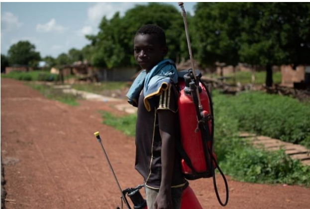
Sensibilisation à la permaculture et au danger du glyphosate