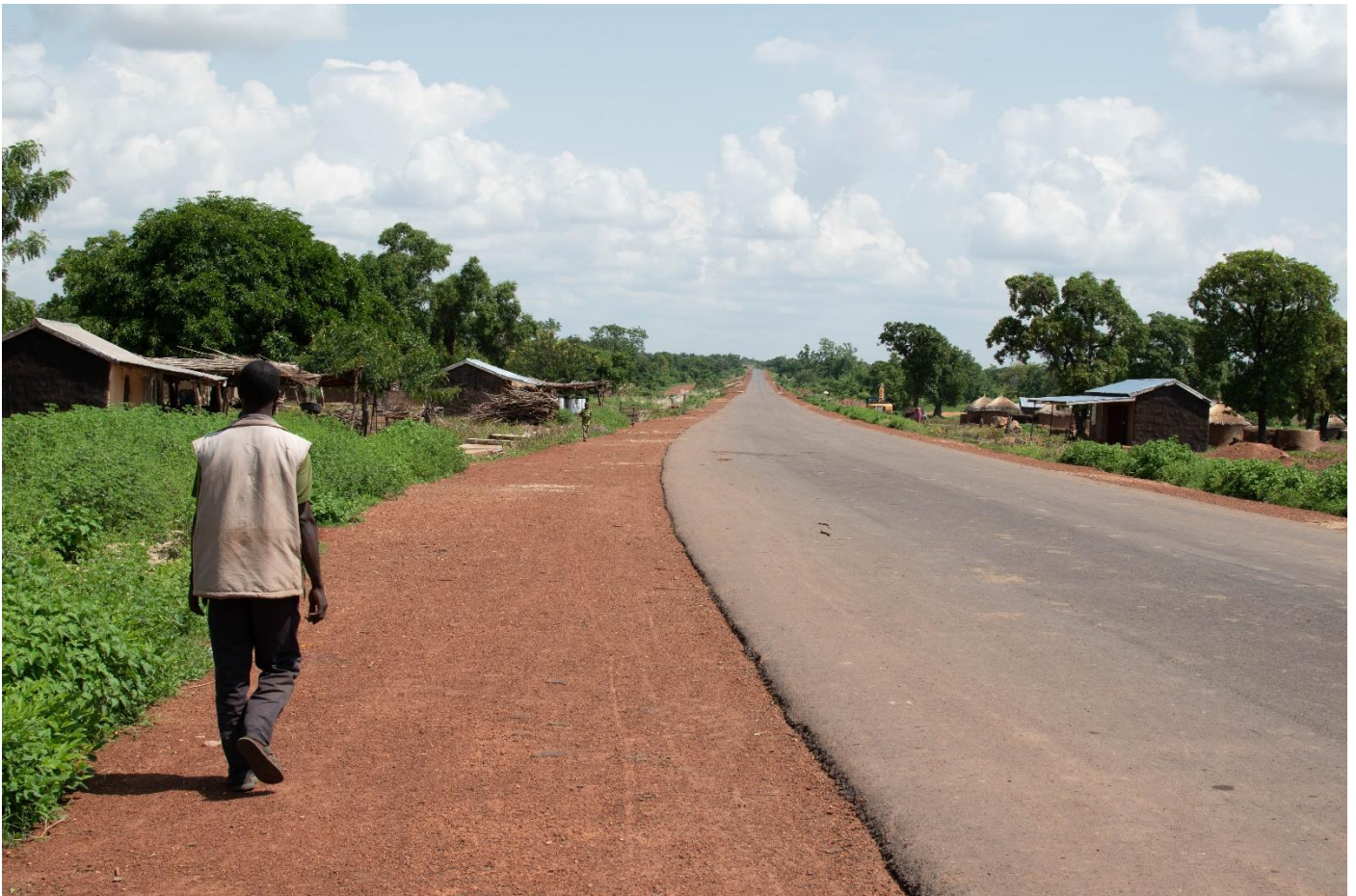
La route principale traversant le village de Borgou

Rédaction : Muhammed Sarikaya Hubert Gaertner