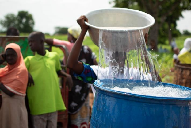
Château d'eau village de Natchabonga