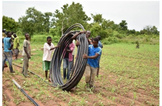
Rénovation des tuyauteries de deux anciens châteaux d'eau