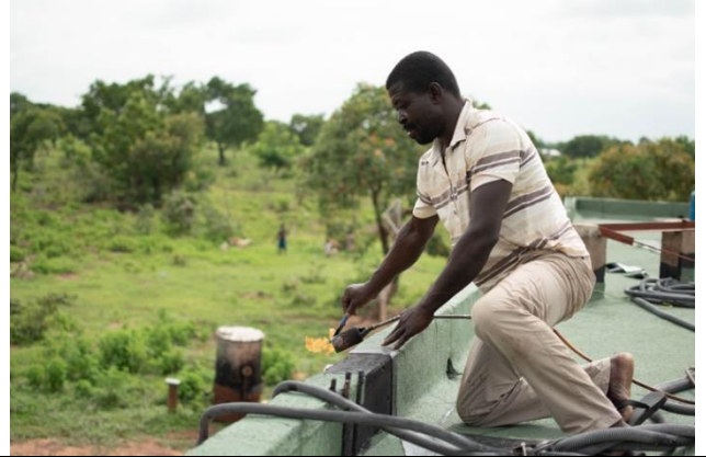
Rénovation et étanchéité du toit du centre d'hébergement